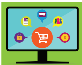
Online-Einkäufe sind weit verbreitet

Der Online-Verbraucher kann sich über die Qualität der Güter informieren, an denen er interessiert ist, selbst auf Entfernungen von hunderten oder gar tausenden Kilometern. Er ist in der Lage, Preise zu vergleichen oder kann die Zufriedenheit anderer Käufer mit einer bestimmten Ware feststellen, z. B. indem er die Reviews liest.