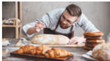
Die Backwaren werden von vielen Verbrauchern bevorzugt.