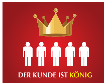
„Der Kunde ist König“ – eine Formel, die heute noch aktuell ist.

An der Aufführung des Stückes nehmen auch die anderen Schüler mit Bewertungsbögen teil. Nach der Aufführung folgt eine Debatte zu dem Thema „Der Kunde ist König – Pro und Kontra“.